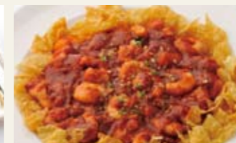
芝海老のチリソース炒め [1人前] ¥500