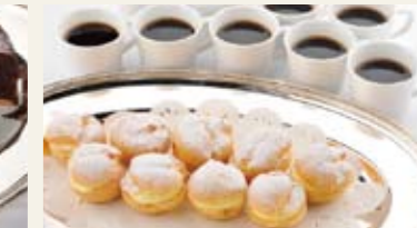
プチシュー(コーヒー付) [1人前] ¥500