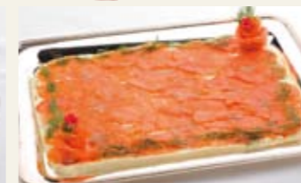
スモークサーモンのピザ [1人前] ¥500