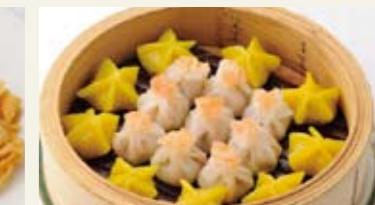
蒸し点心2種 [1人前] ¥500