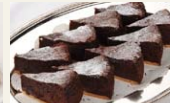
クラシックショコラ [1人前] ¥500