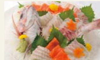
真鯛の姿盛と信州サーモンの盛り合わせ [9人前] ¥4,500