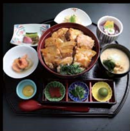
信州白馬豚角煮丼御膳